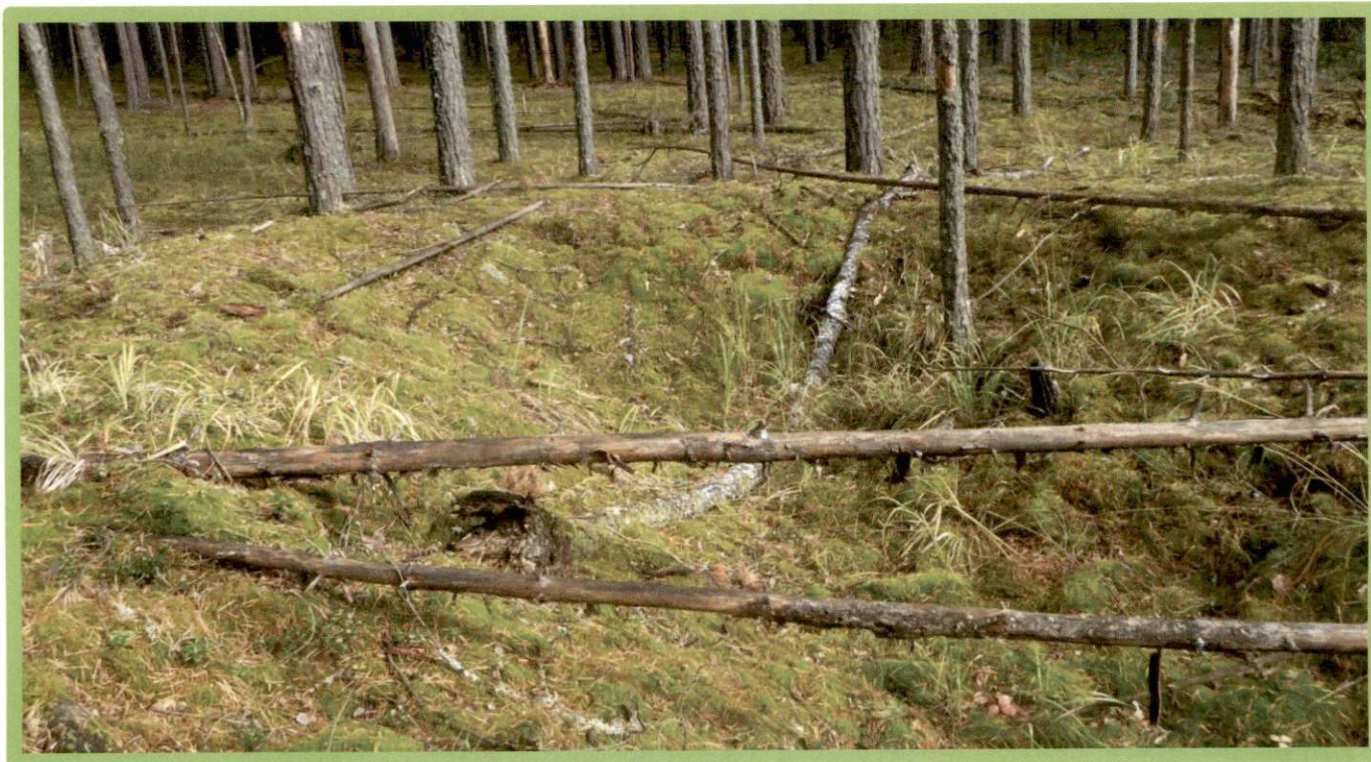
Изображение № 1 Валежник

Примеры валежника (смотри изображения №№ 1,2,3).