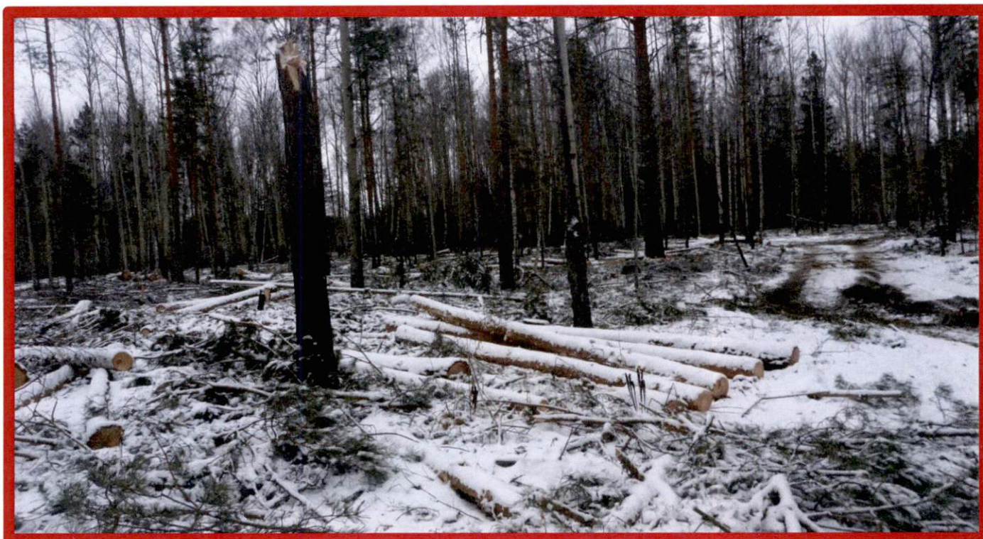
Изображение № 7 Брошенная древесина вдоль лесовозных дорог. Не является валежником