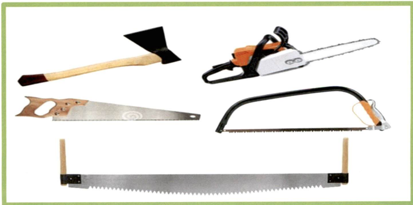
Изображение № 8 Разрешенные инструменты для заготовки

При заготовке валежника допускается применение ручного инструмента (ручных пил, топоров, бензопил) (смотри изображение 8).