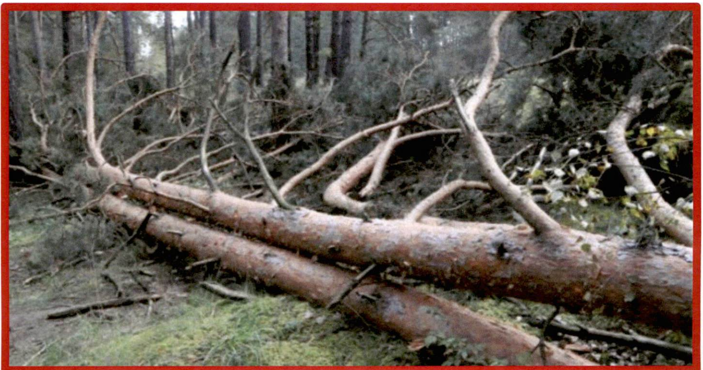
Лежащее на поверхности земли ветровальное дерево, не имеющее признаков отмирания. Не является валежником

Кроме того, необходимо обратить внимание, что деревья, которые лежат на земле, но не имеют признаков естественного отмирания (имеют зеленую листву или хвою), определять как «мертвые» не допускается (смотри изображение № 5).