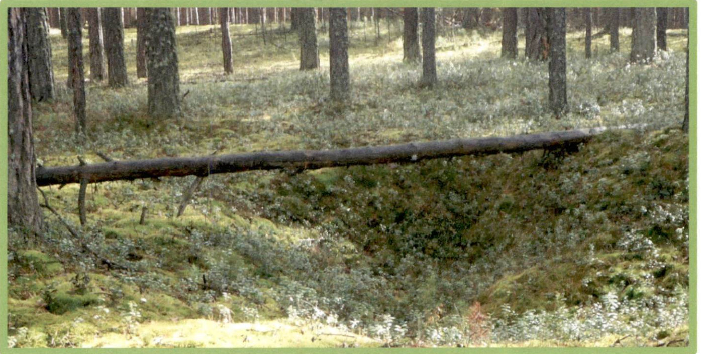
Изображение № 3 Валежник